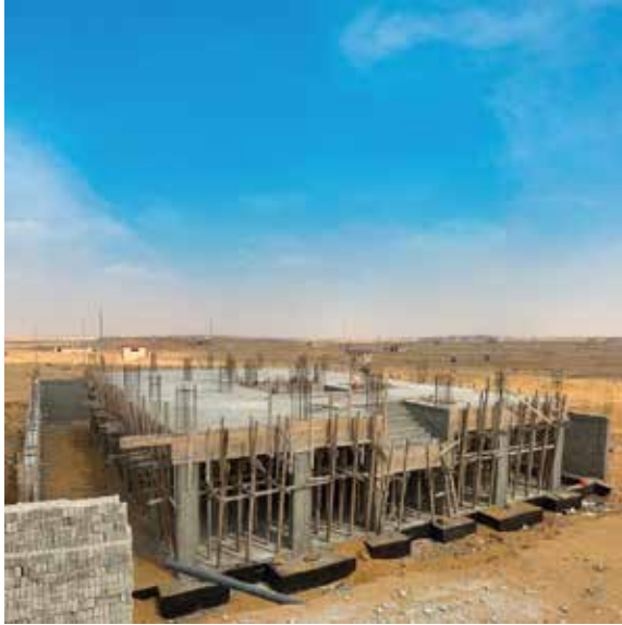
تحت الإنشاء VIVA 1