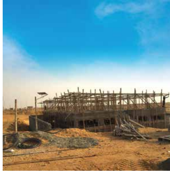
تحت الإنشاء VIVA 2