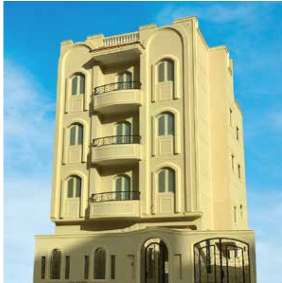
تم الإنشاء VIVA 3