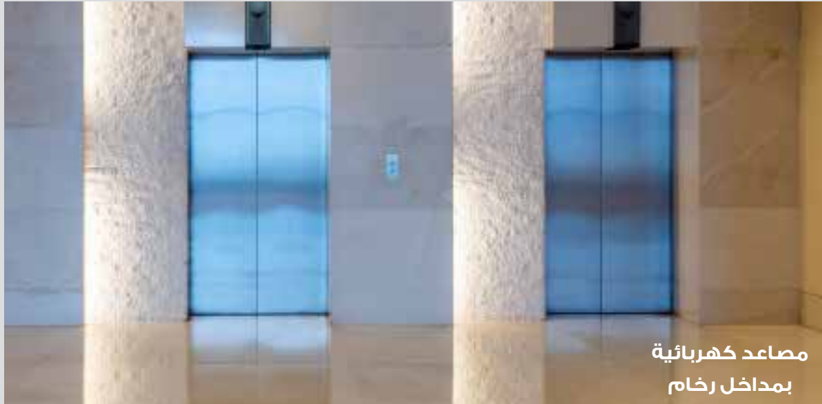
مصاعد كهربائية بمداخل رخام